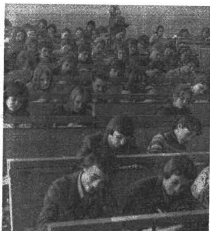
Первокурсники факультета точной механики и вычислительной техники на лекции по физике.