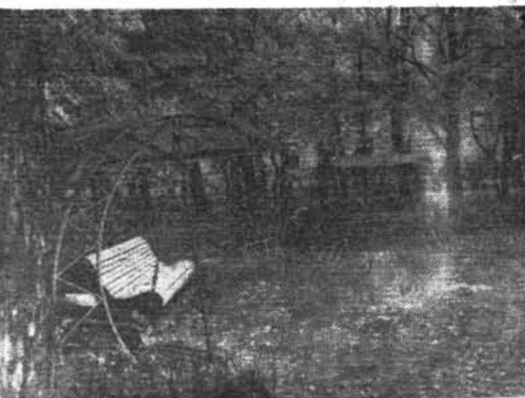
Осенние мотивы. В парке у главного корпуса института.

Береза. Почему из всех деревьев нашего Севера она одна такая белоствольная? Долги-