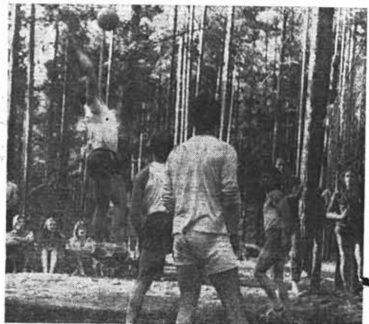
Начался студенческий чемпионат города по волейболу. Среди шестнадцати коллективов, претендующих на победу, — команда ЛИТМО. На снимке: тренировка волейболистов в спортивном лагере института.