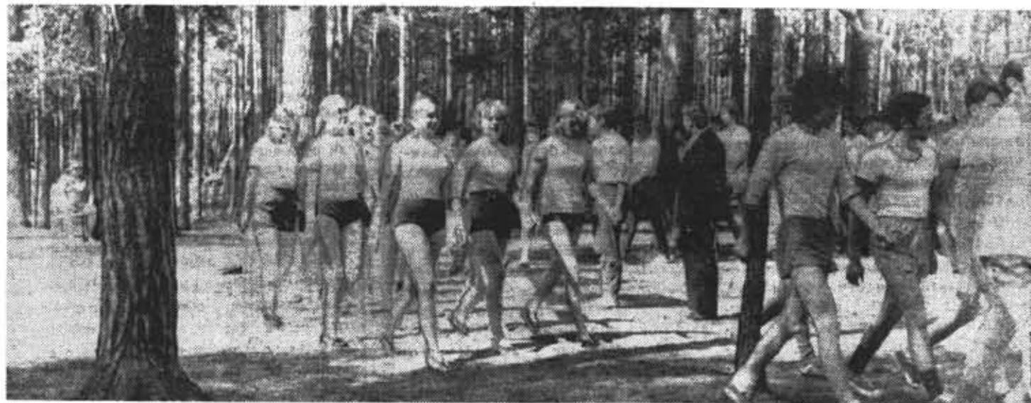
На спартакиаде спортивно-оздоровительного лагеря института.