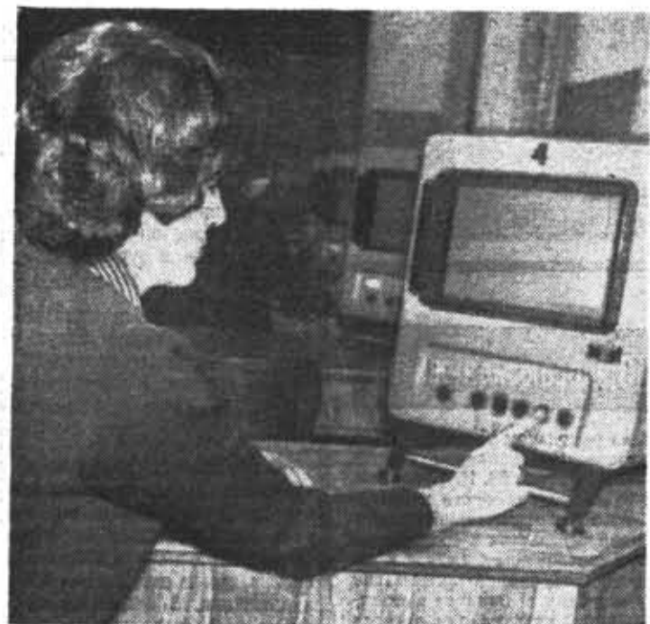
Теперь уже трудно представить себе учебный процесс без широкого внедрения механизированного контроля успеваемости. На снимке: в аудитории № 320.