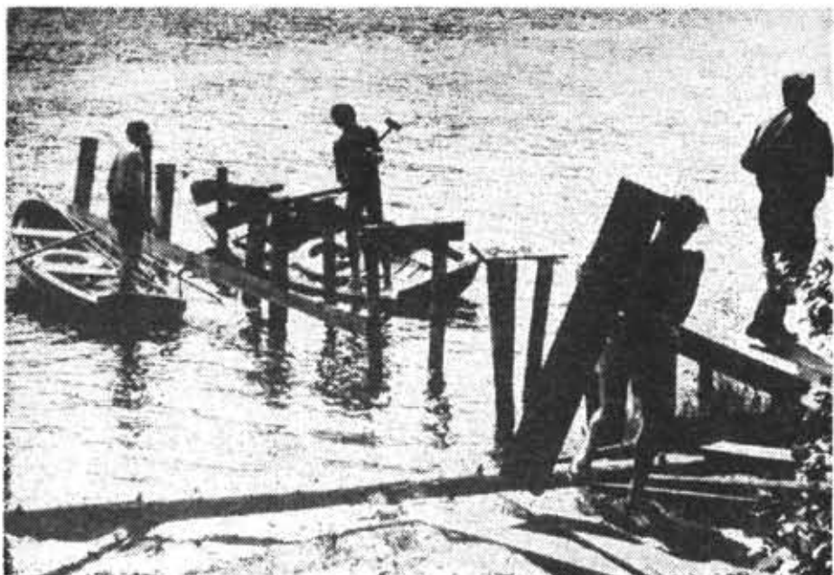
ПЕРЕД ОТПРАВЛЕНИЕМ НА РЫБАЛКУ.