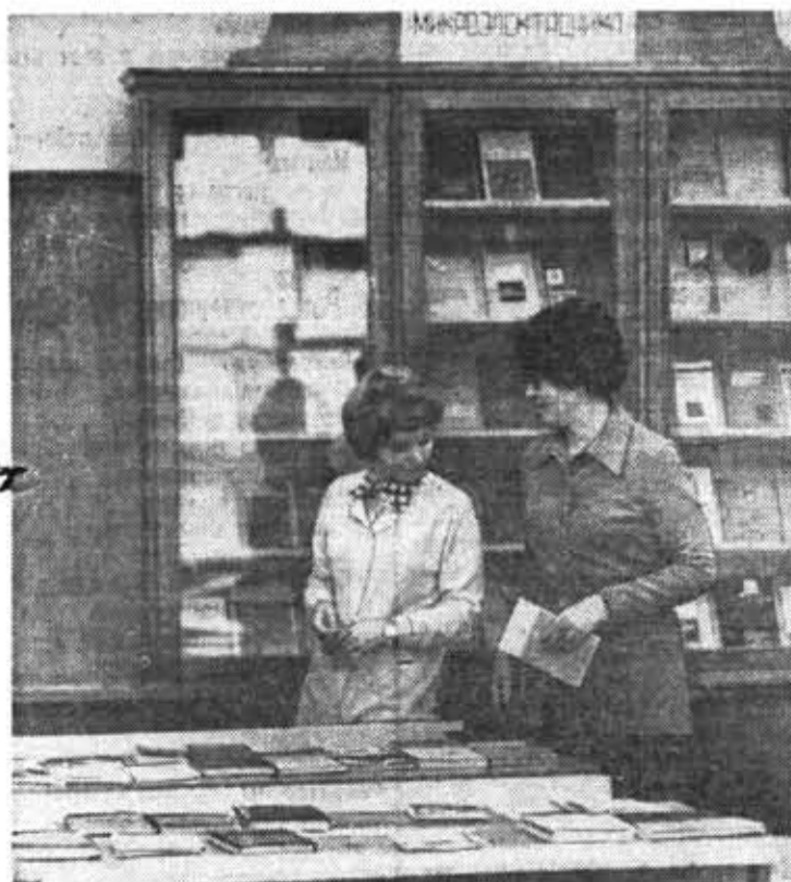
В институтской библиотеке делается многое, чтобы огромный поток научно-технической литературы находил своих адресатов. Здесь постоянно пополняются стелды новых поступлений, проводятся дни открытого просмотра литературы.

выпускник механико-оптического отделения ПРУ 1915 года