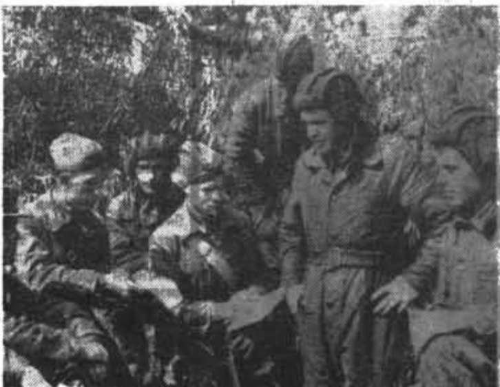
◆ Партийное собрание на фронте.

чей на советско-германском фронте продолжалась невиданная в истории борьба. И на протяжении всего этого периода советско-германский фронт был главным фронтом второй мировой войны. Из 13,6 млн. убитых, раненых и пленных 10 млн. человек фашистская Германия потеряла на советско-германском фронте. Здесь было уничтожено три четверти гитлеровской авиации, подавляющая часть артиллерии и танков, свыше 1600 боевых кораблей и транспортных судов.