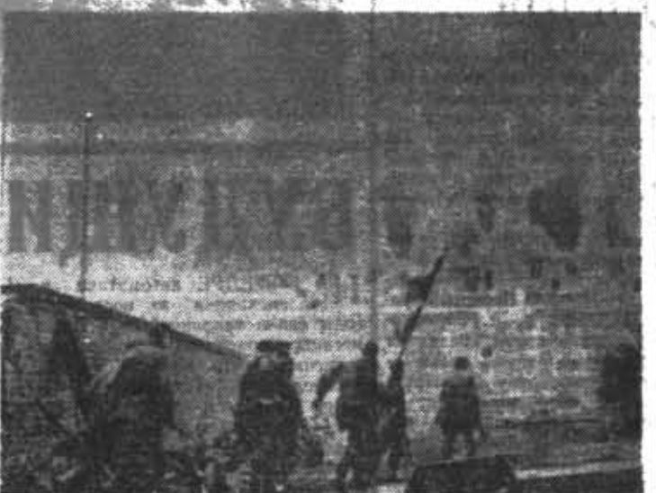
◆ К рейхстагу!

„КПСС рассматривает защиту социалистического Отечества, укрепление обороны СССР, мощи Советских Вооруженных Сил как священный долг партии, всего советского народа, как важнейшую функцию социалистического государства“.