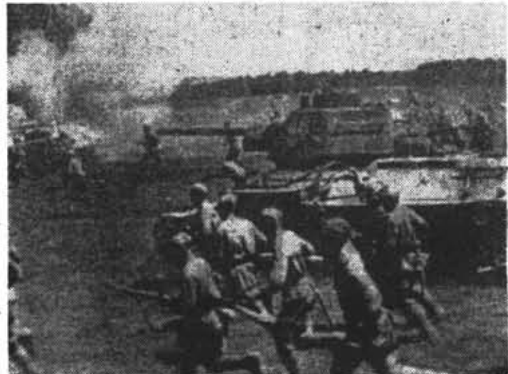
◆ Бой за Минск.

ЕЩЕ в предвоенные годы, учитывая опасность нападения на СССР, партия провела большую работу по укреплению обороноспособности страны. Вот лишь одна цифра. Накануне войны темпы роста выпуска продук-