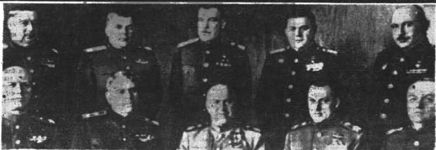
◆ Командующие фронтами (слева направо): в первом ряду — Маршалы Советского Союза И. С. Конев, А. М. Василевский, Г. К. Жуков, К. К. Рокоссовский, К. А. Мерецков; (во втором ряду) — Ф. И. Толбухин, Р. Я. Малиновский, Л. А. Говоров, генералы армии А. И. Еременко, Н. Х. Баграмян. 1945 год.

Уже в первые годы войны Советский Союз оказывал многим пораженным фашистской Германией народам военную и материальную помощь. На территории СССР, при всестороннем содей-