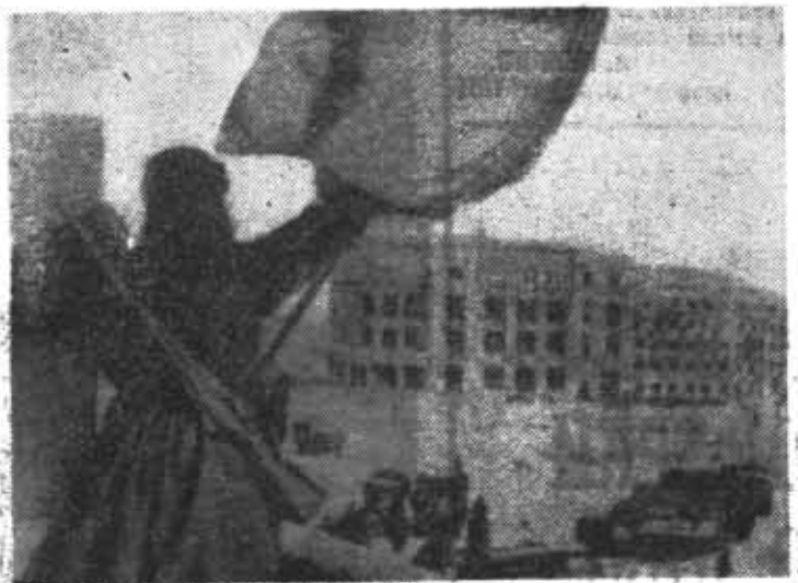
◆ Вооружение Красного знамени в Сталинграде.