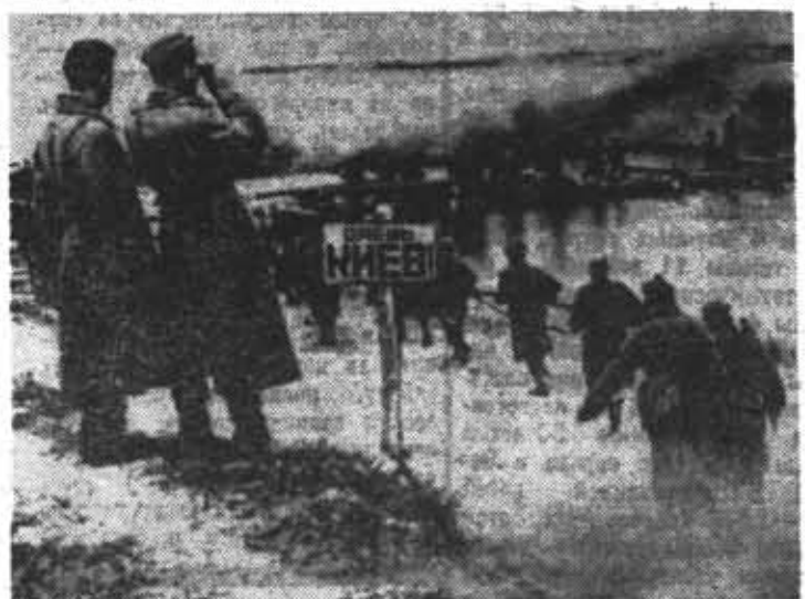
◆ Переправа советских войск через Днепр. Октябрь 1943 года.