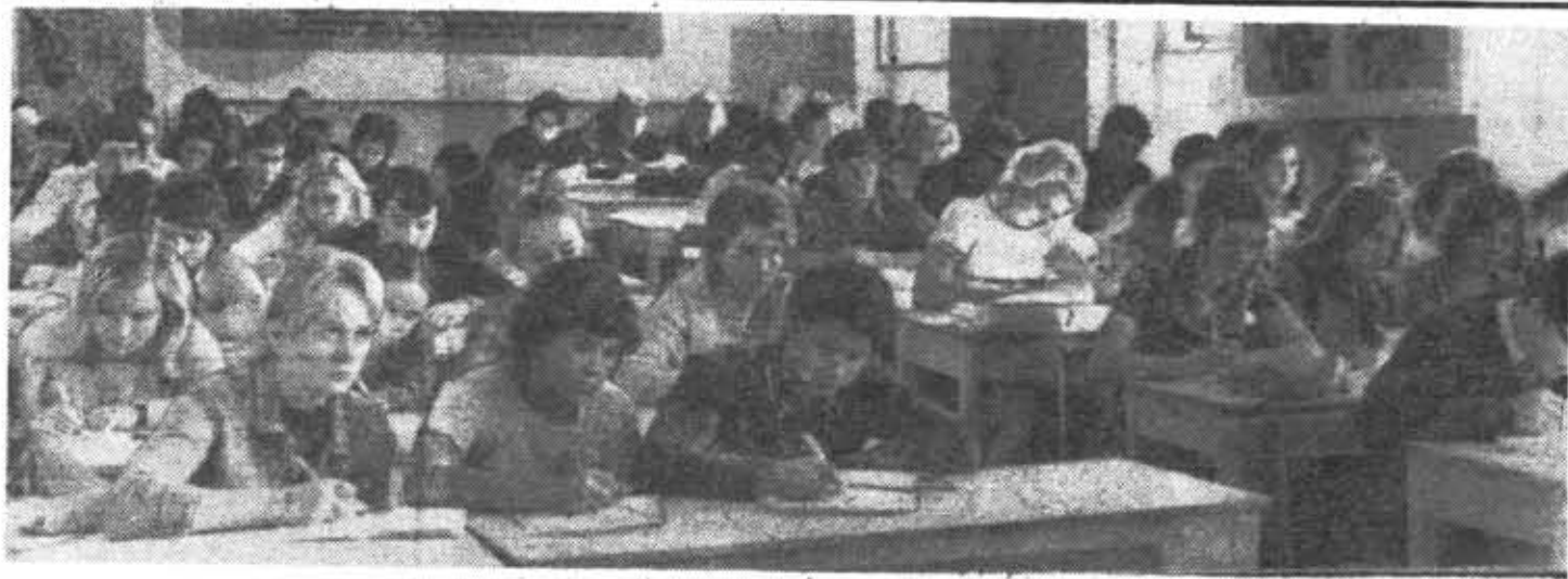
Второкурсники факультета оптико-механического приборостроения на лекции по математике.