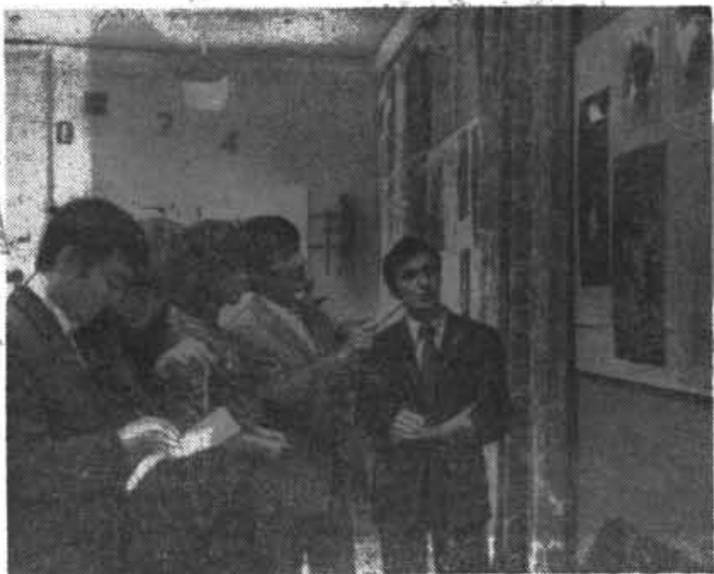
На снимке: на фотодискуссии «Ловите миг удачи» в общежитии на Вяземском.

На выставке экспонировались работы студентов, хорошо знакомых читателям газеты «Надры приборостроению». Ведь студент 500-й