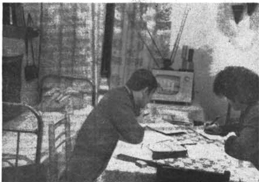
В ОБЩЕЖИТИИ НА ВЯЗЕМСКОМ. ВЕЧЕР НАКАНУНЕ ЭКЗАМЕНА.

Орлеан Трудового Крайнего Знамени типография им. Володарского Лесная Ленинград, Фонтанка, 57.