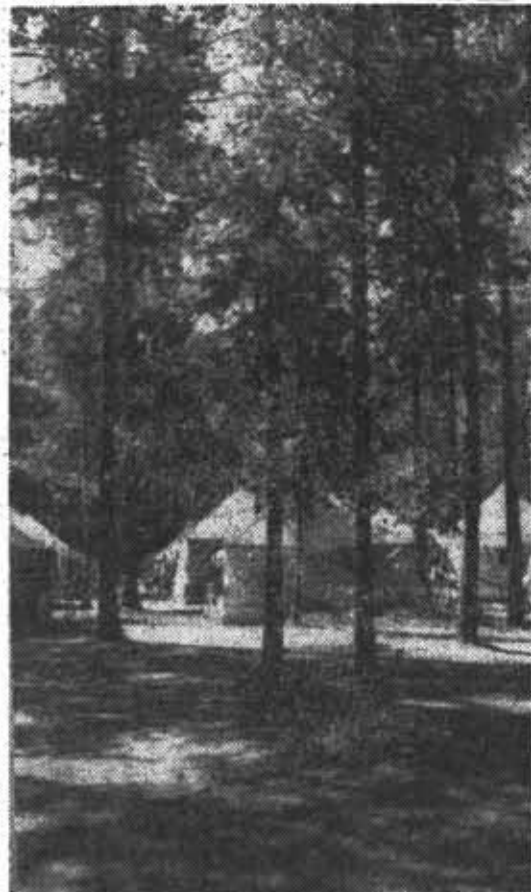
Благодатным — теплым и солнечным — было июньское лето. Добрым словом вспоминают его те, кому посчастливилось побывать в спортивно-оздоровительном лагере ЛИТМО. Студенты не теряли там времени. Многие из них успешно сдали нормативы комплекса ГТО.

В журнале освещаются методы теоретического и экспериментального исследования автоматизируемых производственных процессов, принципы построения систем автоматического контроля и управления.