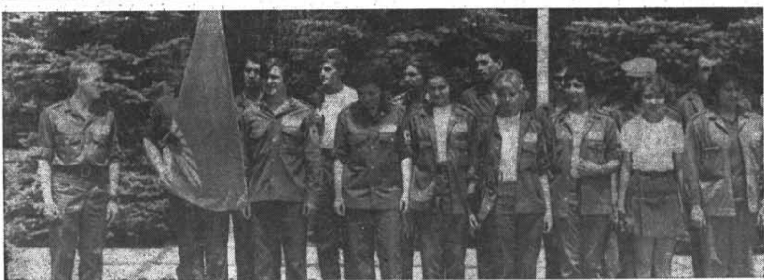
С успехом трудился на стройках в Ставропольском крае интернациональный студенческий строительный отряд «Товарищ». Среди отрядов, работавших в этом районе, он занял первое место. На снимке: митинг на Комсомольской горке в городе Ставрополе, посвященный началу трудового семестра. Отряд ЛИТМО «Товарищ».

Задачами смотра являются дальнейшая активизация участия студентов в работе по повышению эффективности общественного производства, ускорению научно-технического прогресса, лучшему использованию резервов