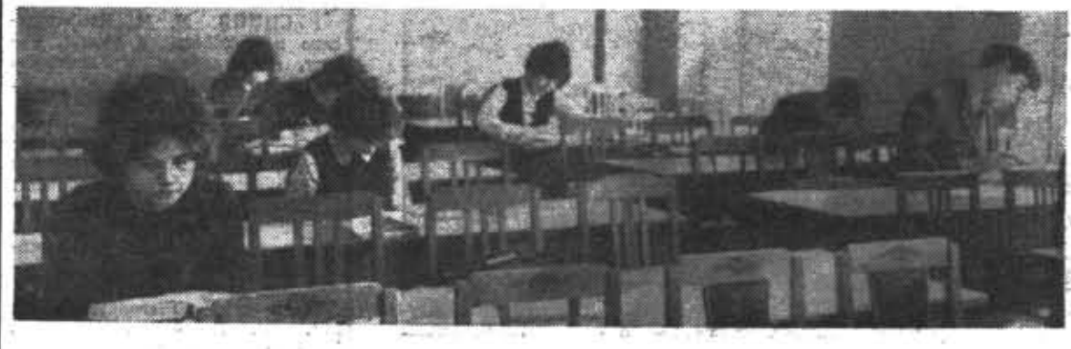
Студенты 400-й группы на экзамене по курсу «Основы конструирования и надежности оптических приборов».