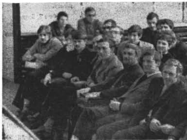
Группа активистов институтской организации ДОСААФ.

Василий Иванович участвовал в прорыве блокады Ленинграда,