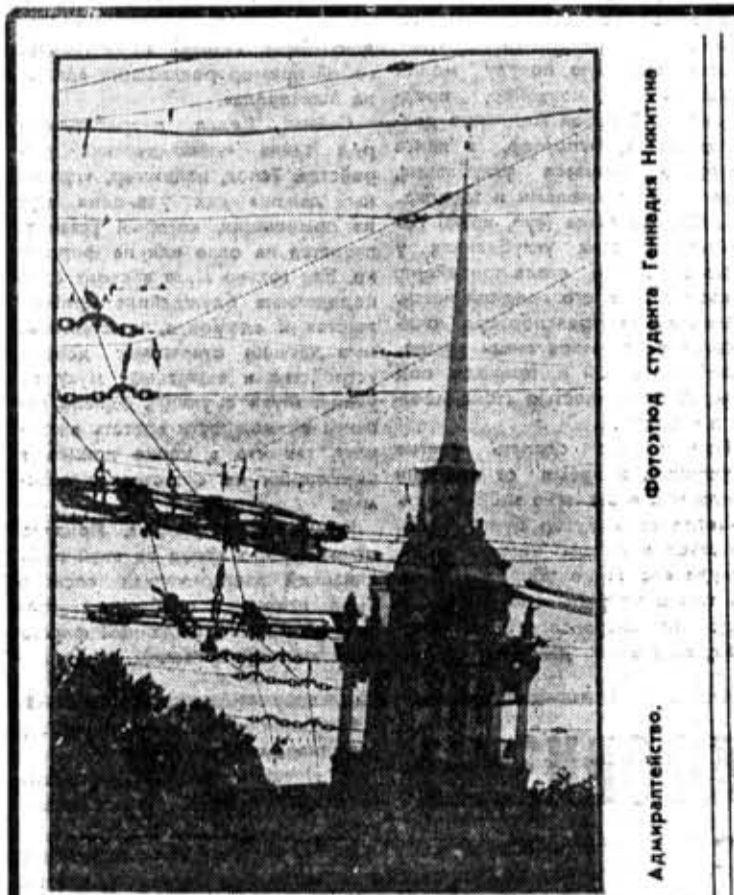
Фотолюб студента Геннадия Никитина