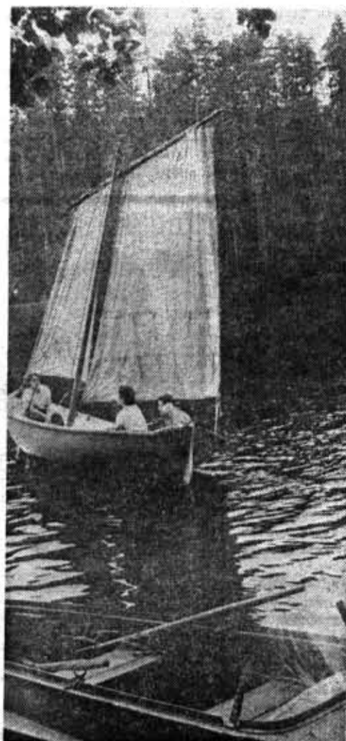
Под парусом на озере Берестовом.