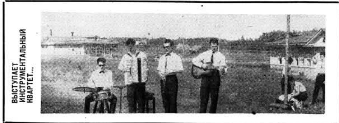
ВЫСТУПАЕТ ИНСТРУМЕНТАЛЬНЫЙ КВАРТЕТ...

Большим спросом у местного населения пользовались популярные современные песни. Од-