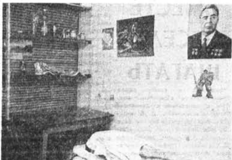
● Во сне и наяву.