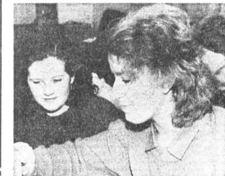
Учебные будни. Лабораторные занятия на кафедре автоматизации и телемеханики.

Для усиления экономических стимулов разработана подожина по бригадному разряду, и с