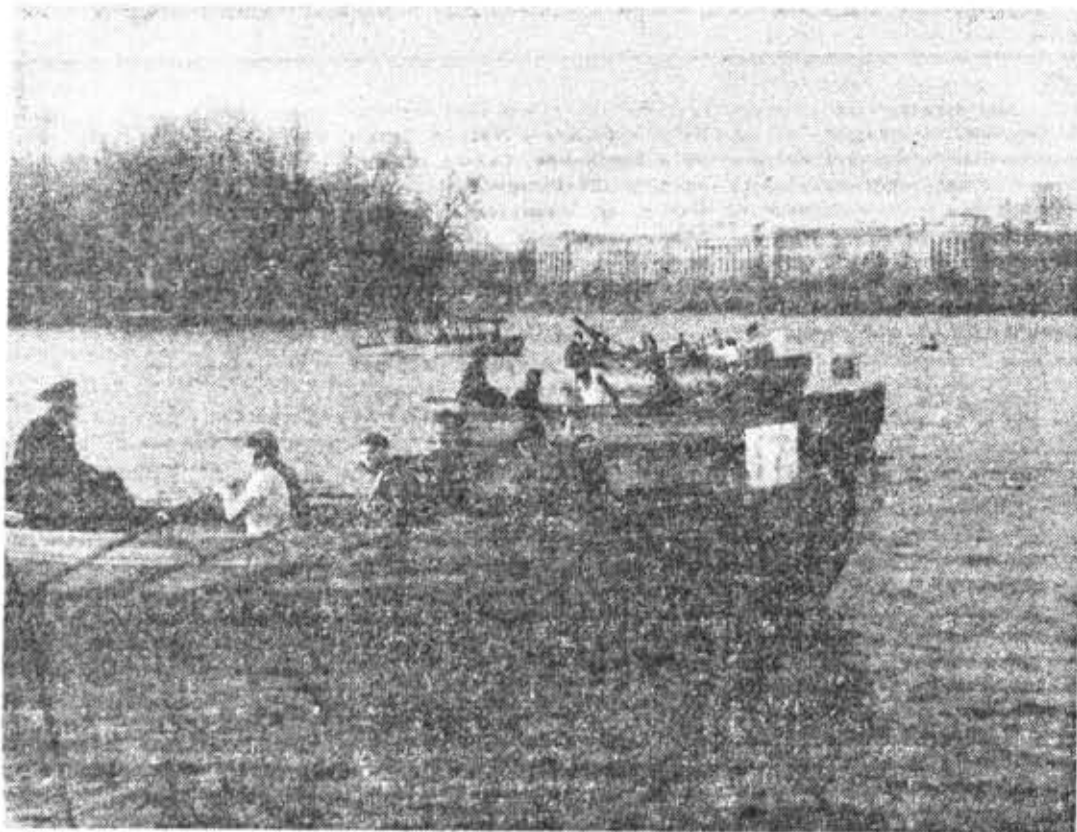
Из водных видов спорта в нашем институте наибольшее распространение получили гонки на шлюпках. На снимке: районные гребные соревнования с участием команд ЛИТМО.

В. СМИЦОВ, член бюро ВЛКСМ специальности «Теплофизика»