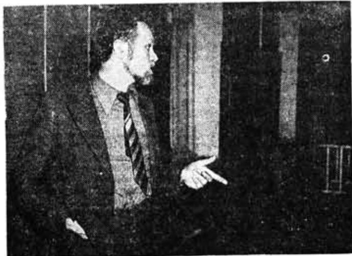
Новое в обучении