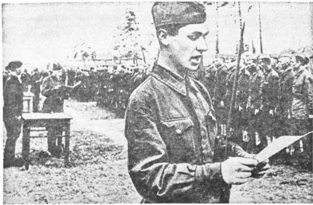
1941 год. Красноармейцы принимают боевую присягу.