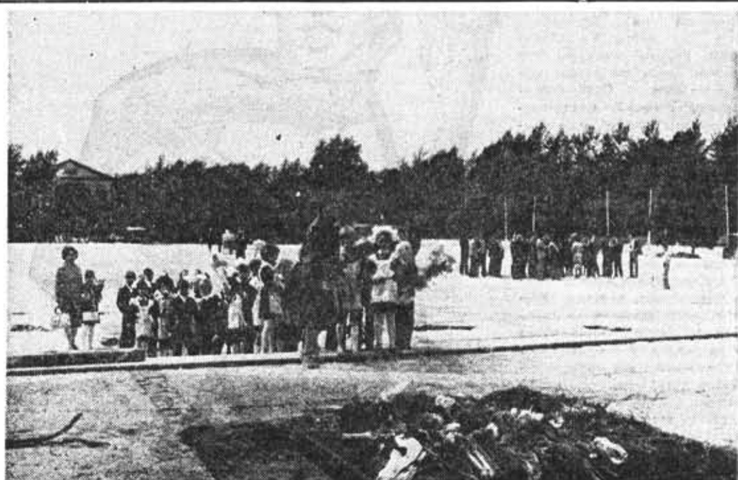
Среди тех, кто приходит сегодня с цветами и солдатским могилам, внуки и правнуки героев, отдавших жизнь за свободу и независимость нашей Родины.