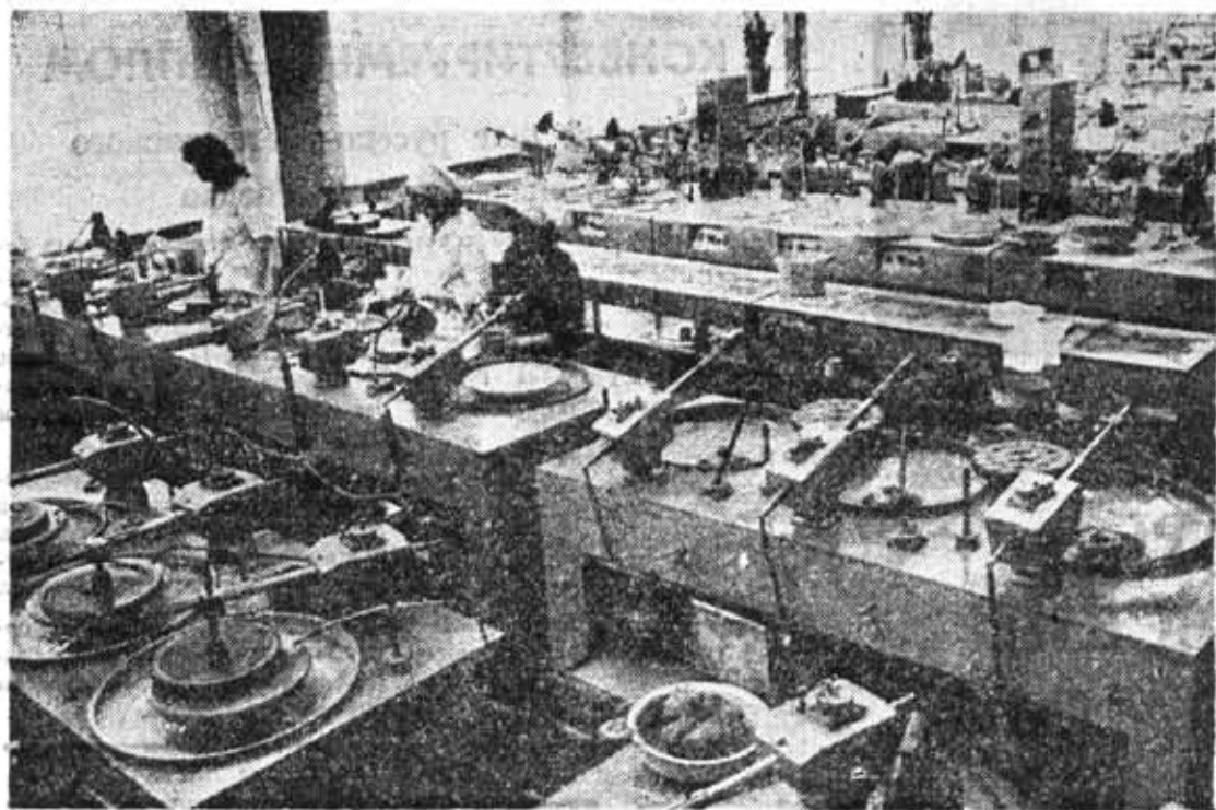
В учебно-производственных мастерских.