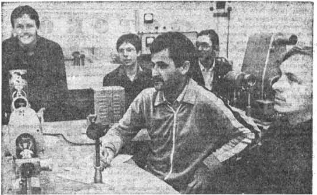
Студенты 436-й группы на занятиях по физической оптике.