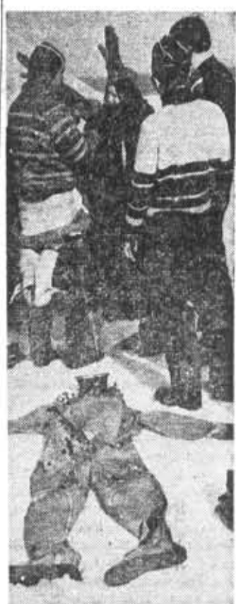
Спортсмены институтского клуба подводного плавания «Варяг» проводят зимние погружения.

4. Значительные расхождения в объемах СРС по одной и той же дисциплине выявлены на ряде кафедр. Особенно резки эти расхождения на кафедре ТМДП (от 0,47 до 1,65), на кафедре теоре-