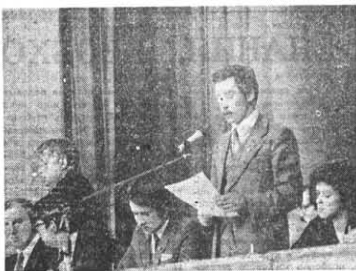
В президиуме XXIX комсомольской конференции ЛИТМО.