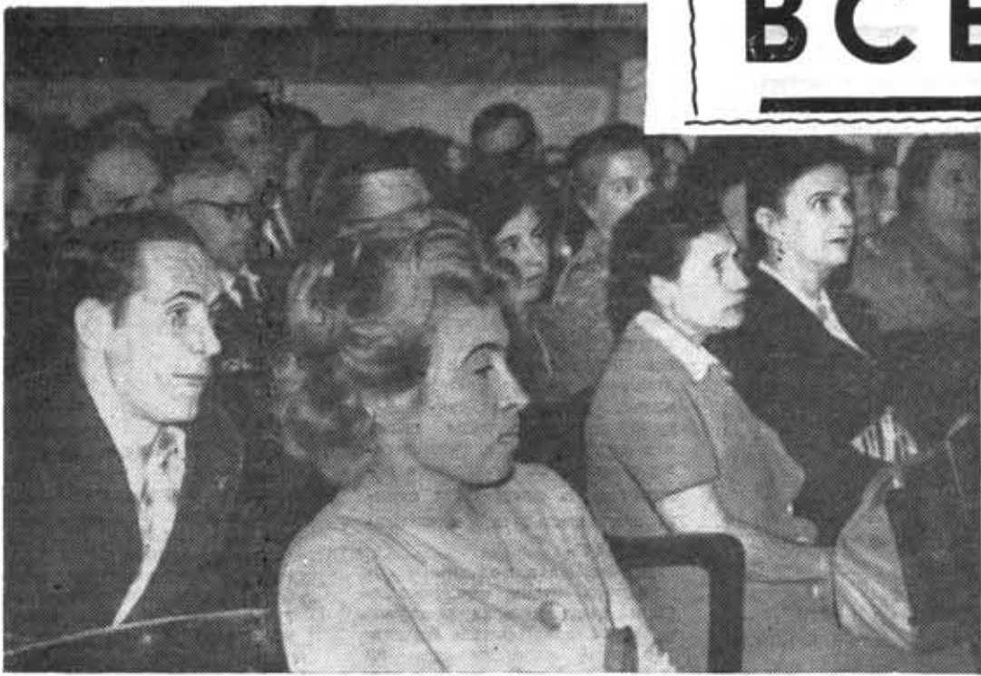
(Продолжение. Начало на 1-й стр.)

выполнению решений июньского Пленума ЦК КПСС. Эту работу в институте возглавляет и координирует идеологическая комиссия парткома. Она накопила уже некоторый положительный опыт, и ее влияние становится все более ощутимым.