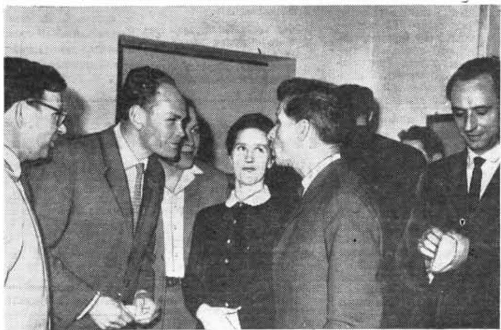
Жаркие дебаты продолжались и во время перерывов.