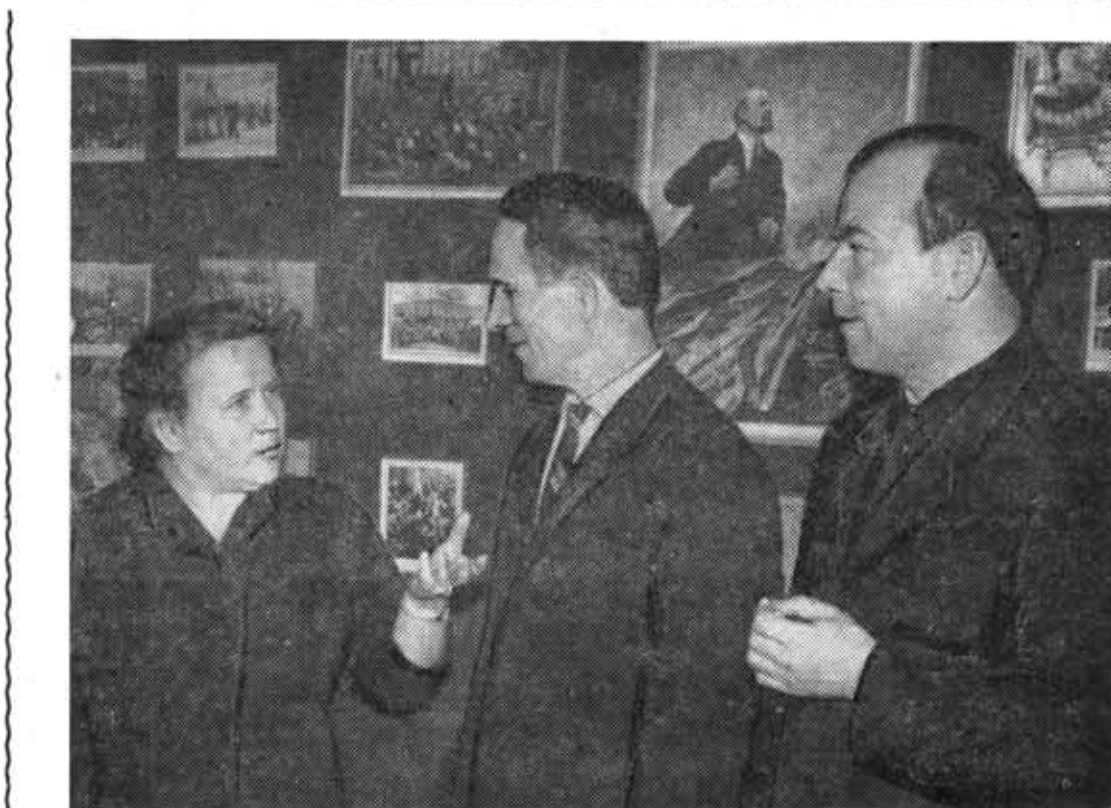
В перерыве заседания.

Нужно отметить, что работа органов содействия ПГК в институте имеет свою специфику. На-