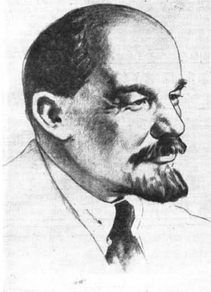
22 апреля — День памяти Владимира Ильича Ленина.