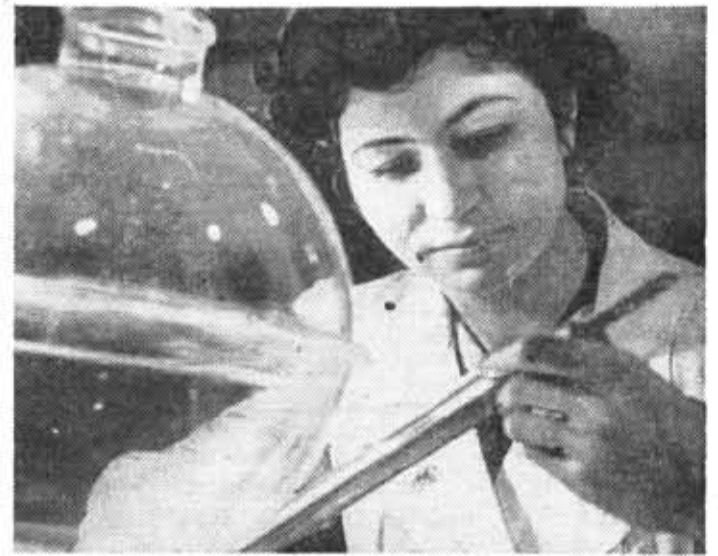
В опытно-конструкторском бюро в Стрельне усилиями инженеров, конструкторов, технологов, художников и рабочих изыскиваются новые способы переработки листовых полимерных пластмасс. Здесь получено много красивых и удобных предметов домашнего обихода.

НА НИЖНЕТАГИЛЬСКОМ заводе пластмасс впервые в СССР начал выпуск труб из фторопласта, который химики называют «органической платиной». Известно, что настоящая платина, как и золото, растворяется в кислотах, а фторопласты не реагируют ни с одним из известных науке и технике веществ. Даже азотная кислота не причиняет им вреда. Трубам из фторопласта ничем ни двухсотградусный холод, ни трехсотградусная жара. Им не страшны удары, они не нуждаются в утеплении. Тагильские трубы завоевывают признание во многих областях науки и техники.