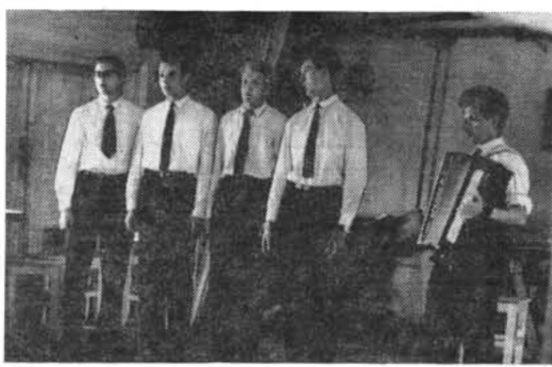
Этот квартет во время своих выступлений завоевал завидную популярность у многочисленных слушателей Волго-Балта. Разнообразный репертуар этого маленького коллектива исполнялся, как правило, под одобрительные аплодисменты присутствующих.

у двадцать третьего шлюза Волго-Балта, где работали двое студентов из Московского института иностранных языков. Вечером няязовцы пришли к нам и начался шахматный матч Москва — Ленинград. И как приятно: Ленинград победил!