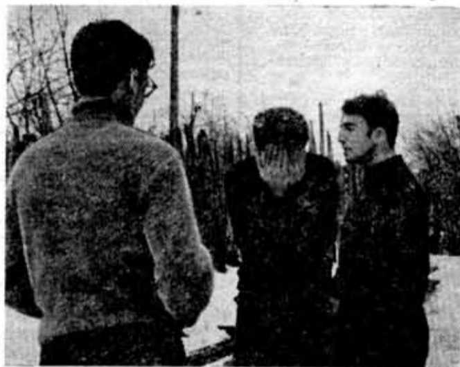
И на улице можно репетировать.

...После концерта разместились на ночлег. Первый день нашего похода окончен. У каждого этот день вызвал массу чувств и мыслей: наши вожак подводит итоги, строят планы на ближайший день. Хочется, чтобы последующие дни прошли отлично, концерты стали бы значительно лучше, чтобы слушатели нас понимали, а мы были бы удовлетворены своей работой. Ну что ж, лиха беда начало!