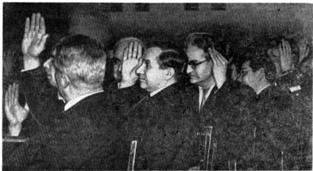
На снимке: участники собрания принимают социалистические обязательства.