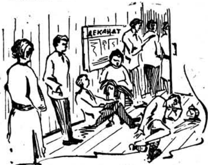
У ДВЕРЕЙ ДЕКАНАТА.

М-40782 Заказ № 327 Типография им. Володарского Ленинград, Фонтанка, 57