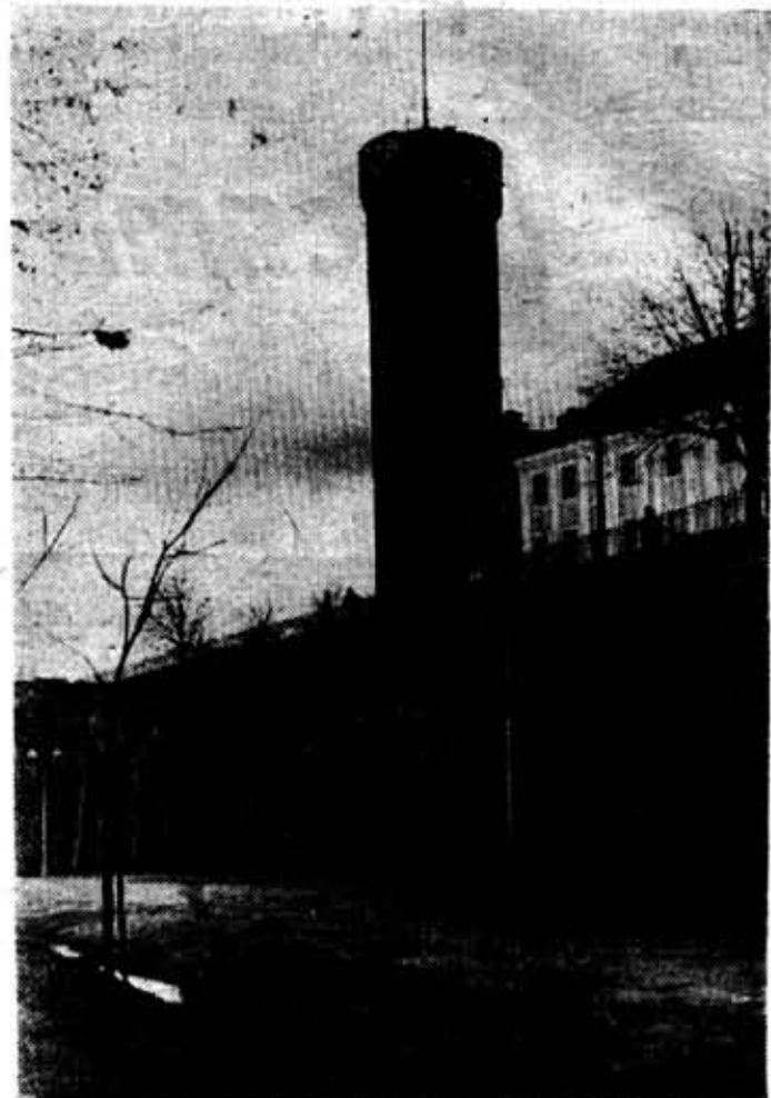
Таллин. Башня «Длинный Герман».