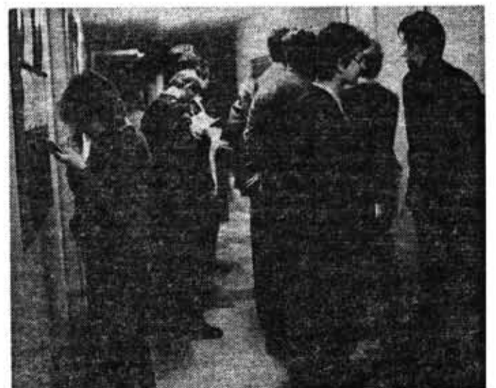
Коридоры волнений, надежд, вопросов...