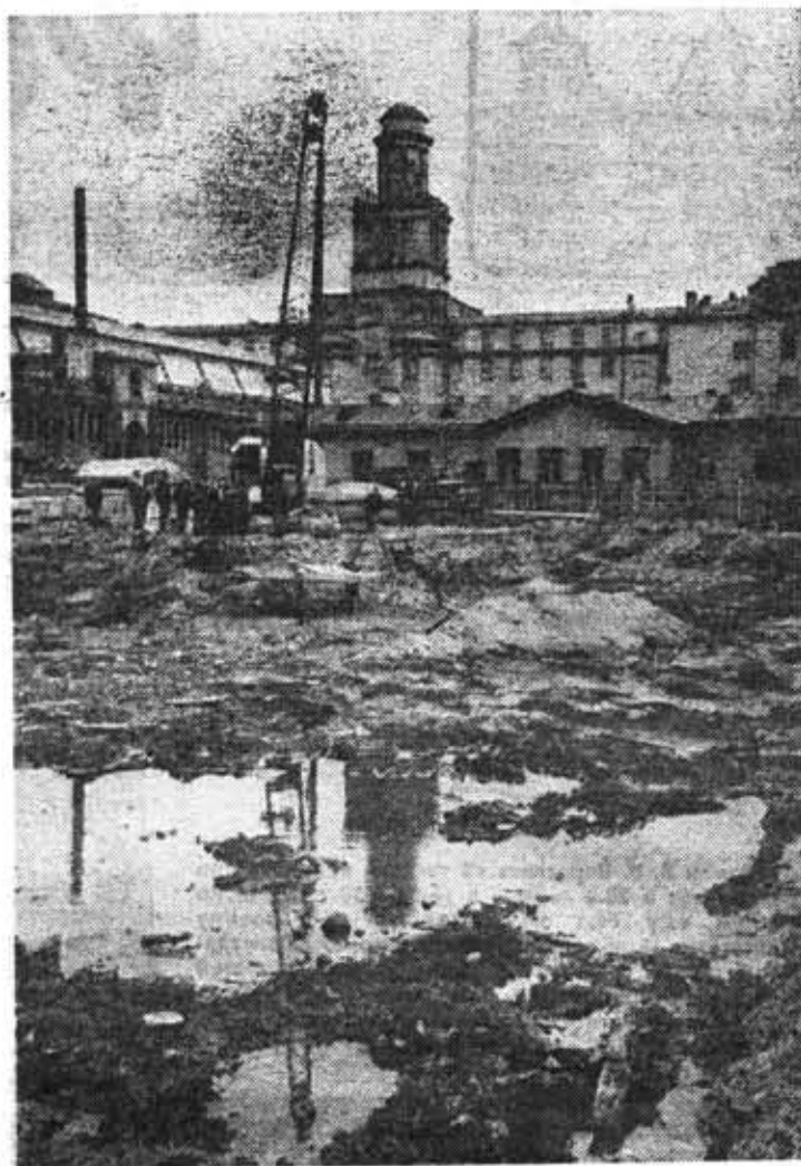
Закладка фундамента нового корпуса на Саблинской улице. Начальства, как у нас водятся, гораздо больше чем исполнителей. 1970 год.