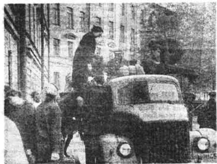
Отъезд на целину. В 1957 г. студенты трудились в Кокчетавской области. Некоторые из них сейчас преподаватели нашего института. Спросите у них — можно ли сравнить работу в бескрайних казахских степях и уборку картошки в Ленинградской области! Впрочем, можно и не спрашивать.