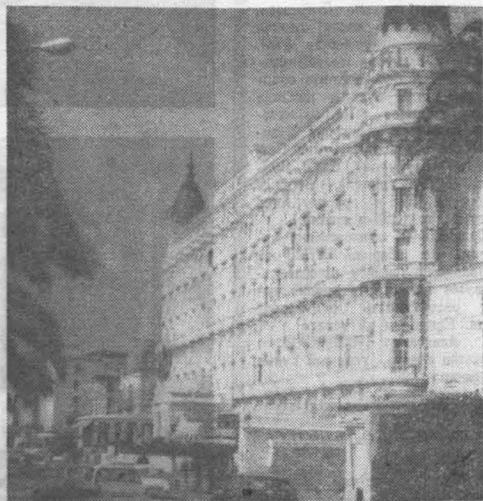
На снимках: Париж, Эйфелева башня (слева); Кан-ны, набережная (справа).