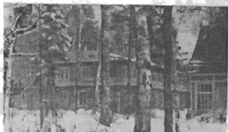
В этом домике активисты набирались ума-разума.