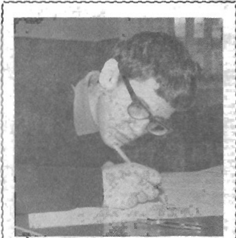
Каждый будущий инженер должен уметь хорошо чертить!

За время обучения в институте студенты нашего факультета получают большой