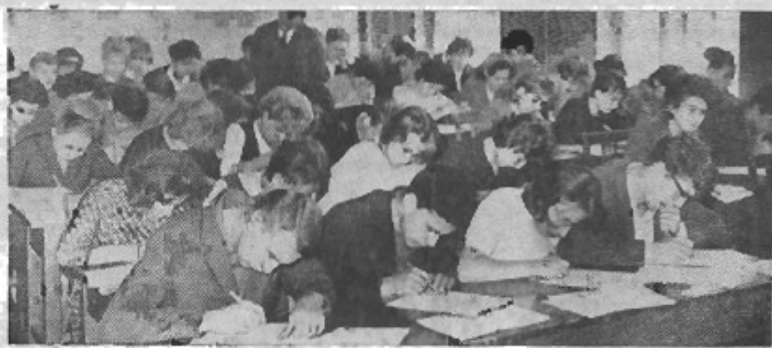
Так выглядела аудитория во время экзамена по математике в прошлом году. Надеемся, что нынешним летом за эти столами сидите вы.

ЛЕНИНГРАДСКИЙ институт точной механики и оптики и его радиотехнический факультет отличаются от других вузов большим объемом и высоким уровнем преподавания физико-математических дисциплин. Значительный объем знаний и также на высоком научном уровне преподаются общинженерные дисциплины: сопротивление материалов, теоретическая механика, технология и другие. Учебный план большой и насыщенный. Это создает некоторые трудности для студентов первых курсов, но обеспечивается основательная база для серьезного изучения специальных дисциплин на старших курсах и для последующей инженерной деятельности.