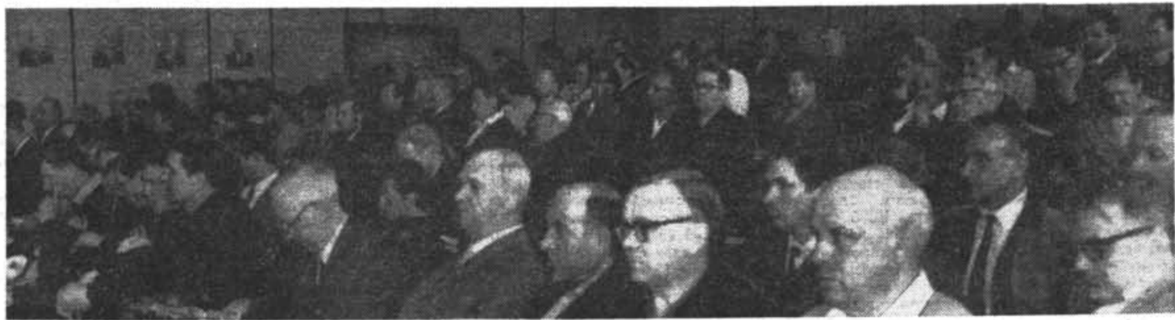
ФОТОРЕПОРТАЖ ВАЛЕРИИ СЛОВЬЕВОЙ С ПАРТИЙНОГО СОБРАНИЯ ИНСТИТУТА — НА СТР. 1—2.