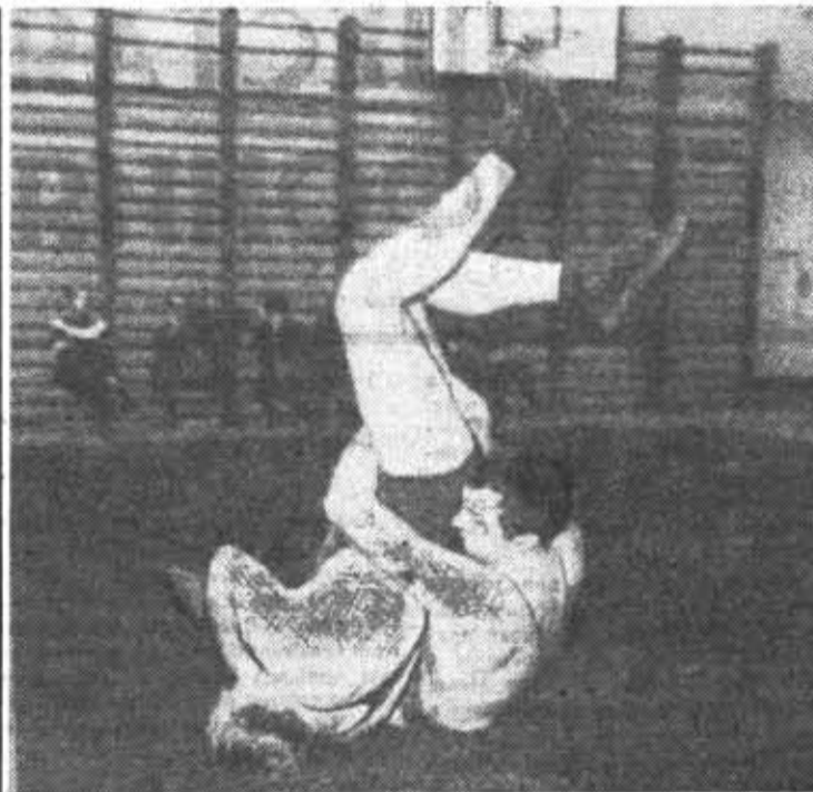
На институтских соревнованиях по вольной борьбе.