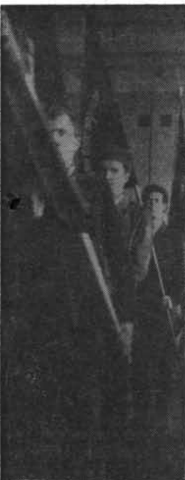
Всероссийное комсомольское собрание. Вынос знамени.

С 19 ПО 21 МАЯ в нашем институте проходила организованная Министерством высшего и среднего специального образования СССР Всесоюзная конференция по созданию и внедрению новых оптических систем различного назначения.