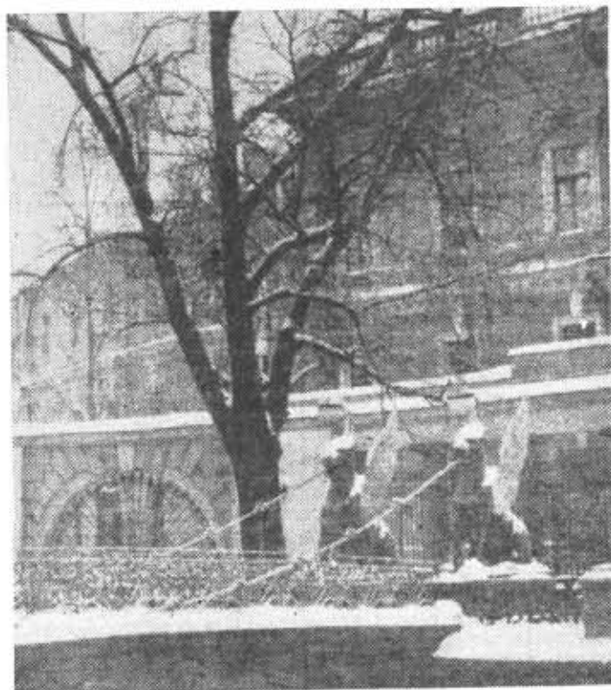
Ленинград в январе. Банковский мостик.