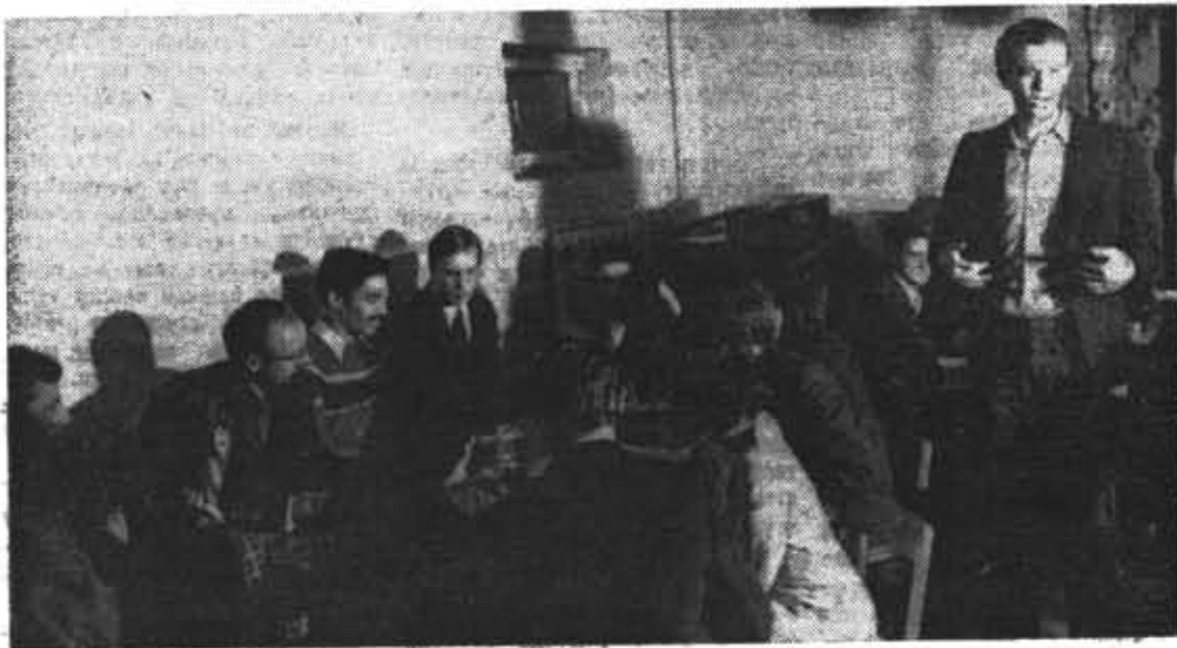
На вечере отдыха в клубе «Теплофизик».