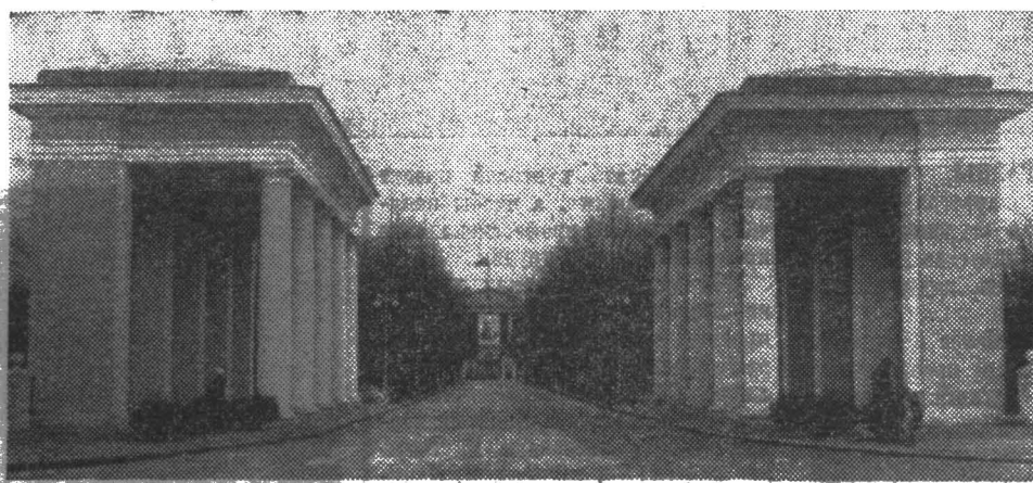
СМОЛЬНЫЙ — ШТАБ РЕВОЛЮЦИИ.

Твой поклонник верный и надежный, О тебе писать всегда я рад, Исторический и молодежный, Ввысь и вширь растущий Ленинград! Сколько есть сокровищ в Землянке И красот, не знающих границ, Столько и в твоём блестящем стаже Славных, героических страниц, Песни о тебе не зря поются, Вся планета чтит тебя не зря, Молыбель трех русских революций, Город мирового Октября! Пусть журчат фонтаны и насады В золотых садах Петродворца, Вспоминая злые дни блокады, Подвиг, оныряющий сердца! Пусть тебя прославят наши внуки, Город побеждающих идей, Город расцветающей науки, Служащий для блага всех людей! Нам твоя земля навеки свята, Сокрушитель настовых преград, Город славы пролетариата, Вечно юный город Ленинград! В. ЧУРИЛОВСКИЙ, профессор