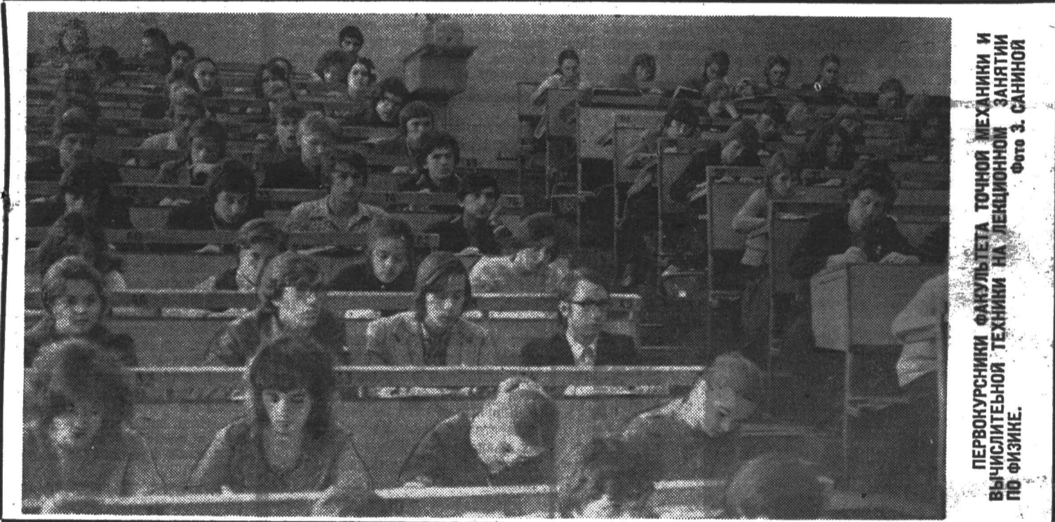
ПЕРВОКУРСНИКИ ФАКУЛЬТЕТА ТОЧНОЙ МЕХАНИКИ И ВЫЧИСЛИТЕЛЬНОЙ ТЕХНИКИ НА ЛЕКЦИОННОМ ЗАНЯТИИ ПО ФИЗИКЕ.

ведет подготовку по 29 специальностям, и вряд ли стоит полагать, что все первокурсники наилучшим образом сориентировались в них и избрали для себя оптимальный вариант. На модную или «красиво» звучащую специальность абитуриент буквально валом валит, зачастую даже не вникая в ее суть. И наша задача — в течение первых трех курсов, пока еще идут общетеоретические и общинженерные дисциплины, помочь студенту верно определиться в этой массе специальностей и специализаций.