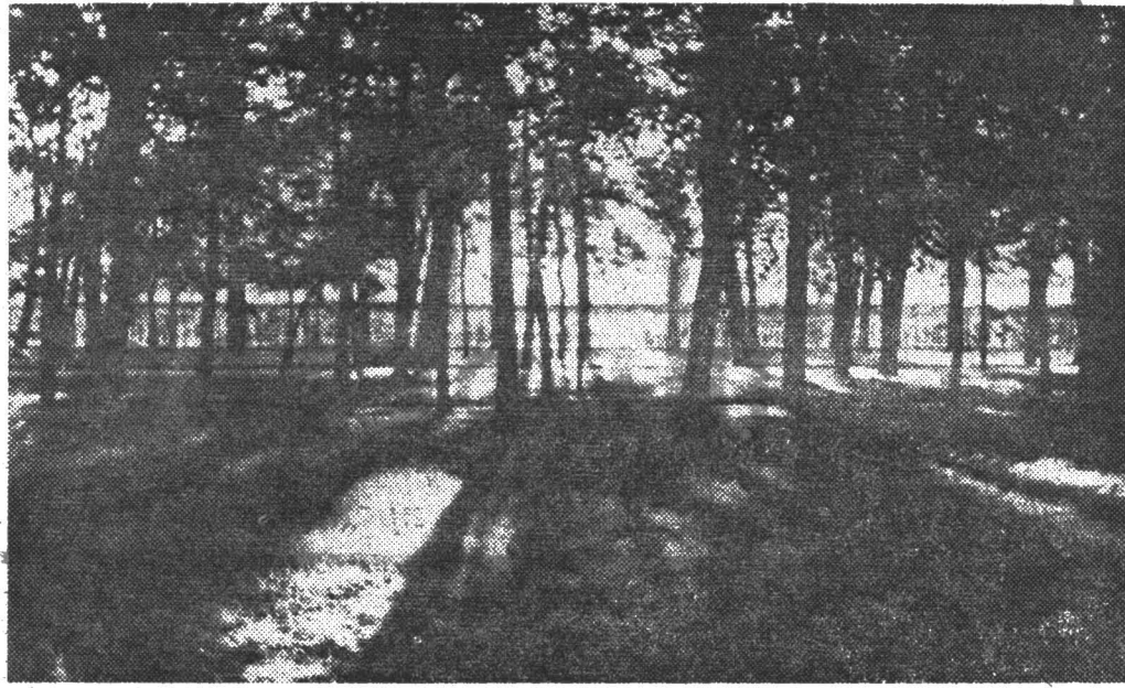
ЗАКАТ. Фотоэтой нашего читателя А. Александрова.

В библиотеку института поступила новая техническая литература: