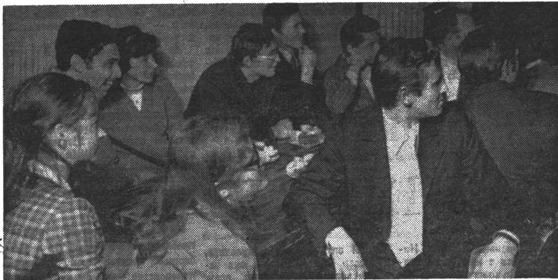
Эффективной формой сплочения студенческих коллективов стали вечера, проводимые кафедральными студенческими клубами. На снимке: заседание клуба «Теплофизик».

Ни одна комсомольская организация, стремясь к совершенствованию своей работы, не сможет обойтись без серьезного развития критики и самокритики. Это безотказно действующий инструмент — если только он в руках мастера и хорошо отлажен.