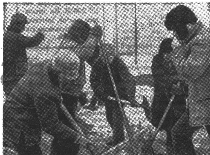
В год 30-летия Великой Победы студенты ЛИТМО принимали активное участие в сооружении мемориала героическим защитникам Ленинграда.