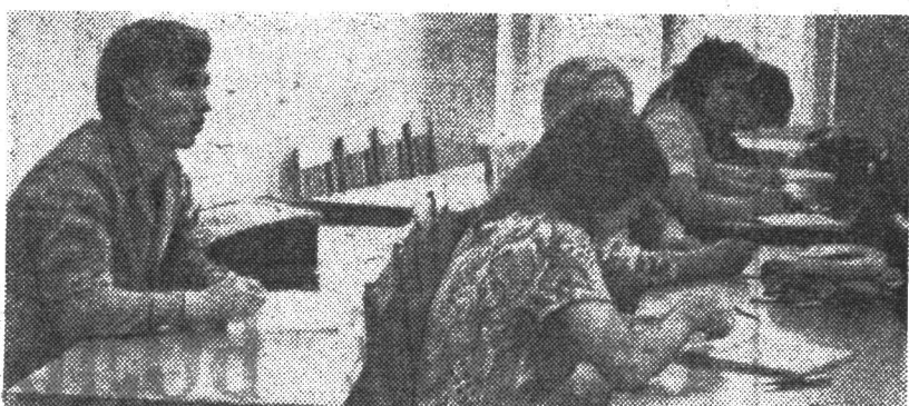
Пятикурсники на лекции по курсу «Цифровые вычислительные машины».

Главным образом это относится к двум лабораторным работам по сопротивлению материалов, выполненным в начале курса, свя-