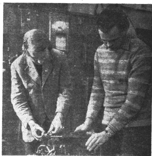
УЧЕБНЫЕ БУДНИ. ЛАБОРАТОРНАЯ РАБОТА НА НАФЭДРЕ БОРТОВЫХ ПРИБОРОВ УПРАВЛЕНИЯ. Фото 3. Саниной

С принципиальной стороны, то есть по своим основным физическим задачам — создания требуемых электроэнергетических процессов для достижения больших