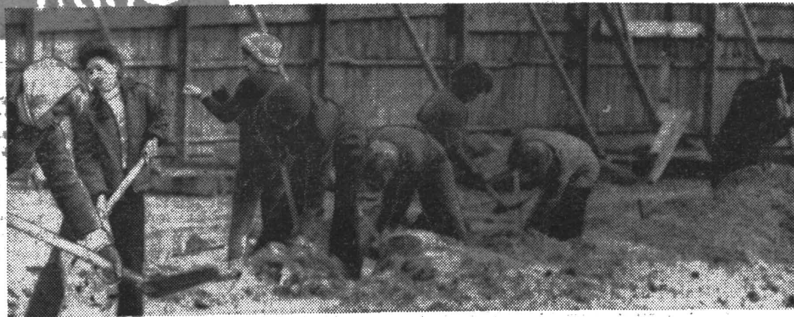
Литмонавты на строительстве памятника героическим защитникам Ленинграда.