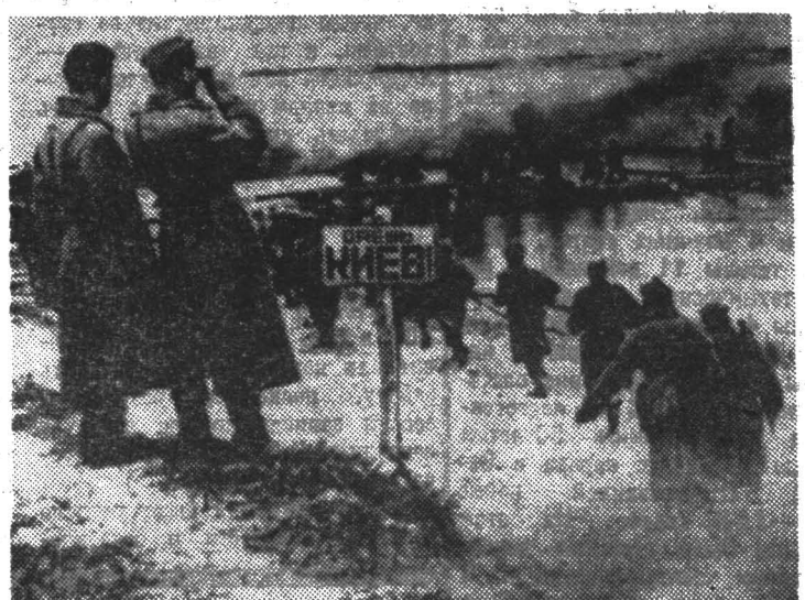
◆ Переправа советских войск через Днепр. Октябрь 1943 года.