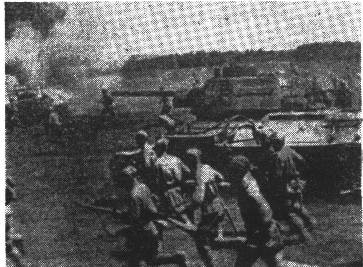
◆ Бой за Минск.

Достижению великих и справедливых целей — защите завое-