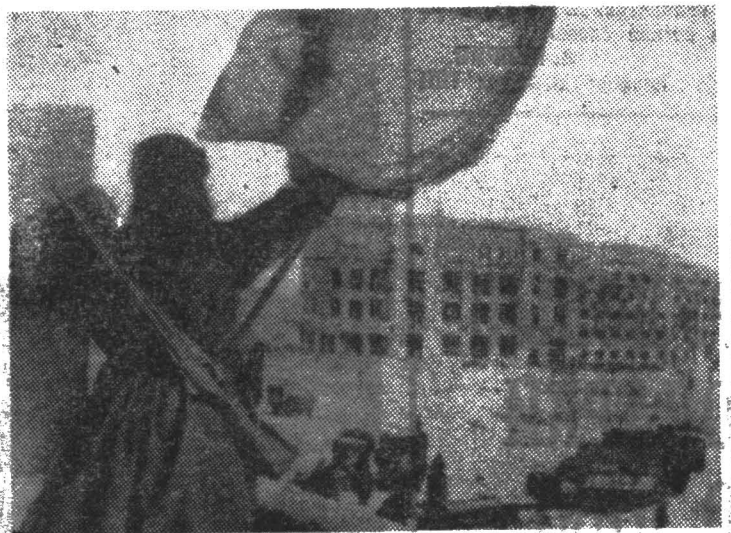
◆ Возвращение Красного знамени в Сталинграде.