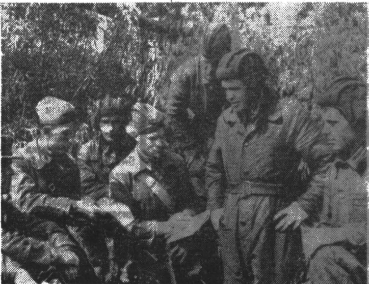
◆ Партийное собрание на фронте.

чей на советско-германском фронте продолжалась невиданная в истории борьба. И на протяжении всего этого периода советско-германский фронт был главным фронтом второй мировой войны. Из 13,6 млн. убитых, раненых и плененных 10 млн. человек фашистская Германия потеряла на советско-германском фронте. Здесь было уничтожено три четверти гитлеровской авиации, подавляющая часть артиллерии и танков, свыше 1600 боевых кораблей и транспортных судов.