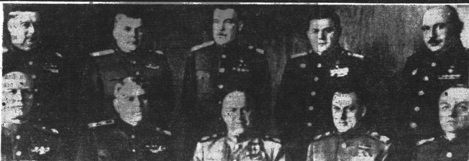
◆ Командующие фронтами (слева направо): в первом ряду — Маршалы Советского Союза И. С. Конев, А. М. Василевский, Г. К. Жуков, К. К. Рокоссовский, К. А. Мерецков; (во втором ряду) — Ф. И. Толбухин, Р. Я. Малиновский, Л. А. Говоров, генералы армии А. И. Еременко, И. Х. Баграмян. 1945 год.

Уже в первые годы войны Советский Союз оказывал многим поработанным фашистской Германией народам военную и материальную помощь. На территории СССР, при всестороннем содей-