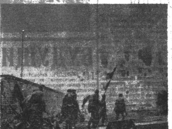
◆ К рейхстагу!