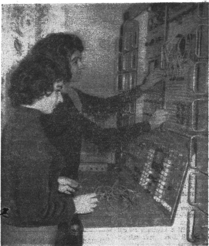
Старшекурсники ФТМВТ широко привлекаются к исследовательским работам на кафедре вычислительной техники. На снимке: работа на АВМ.

В результате проведенных нами опросов и бесед с руководством столовых, расширился ассортимент холодных закусок, в буфетах всегда имеются пирожные и булочки. Не все однако сделано еще, чтобы в столовых