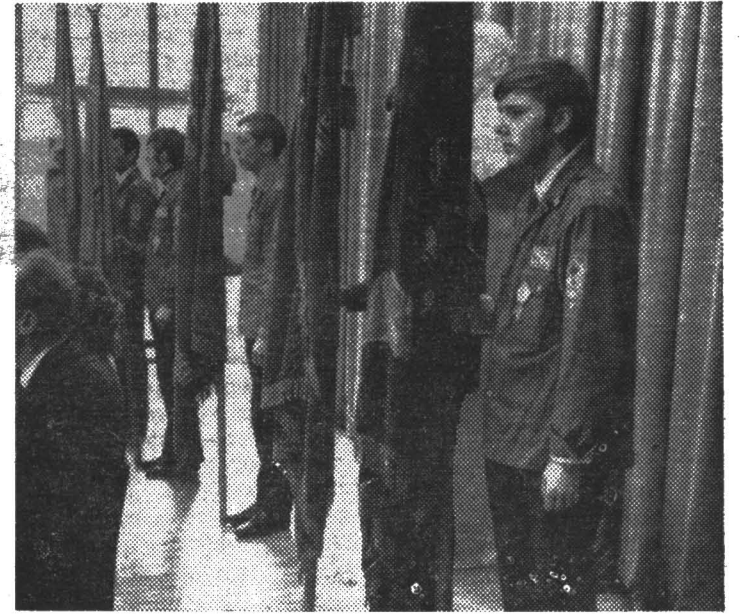
В почетном карауле у знамени комсомольской организации института