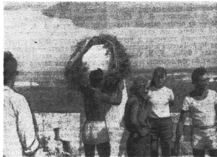
Студенты ЛИТМО, участники похода по местам боевой славы, возлагают венок на братскую могилу воинов, павших в боях за освобождение Крыма, у поселка Оленевка.

Совет ветеранов Великой Отечественной войны ЛИТМО