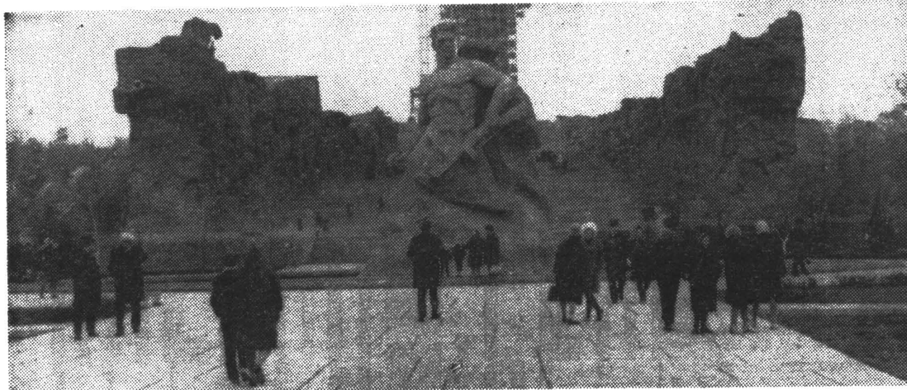
Здесь насмерть стояли герои.