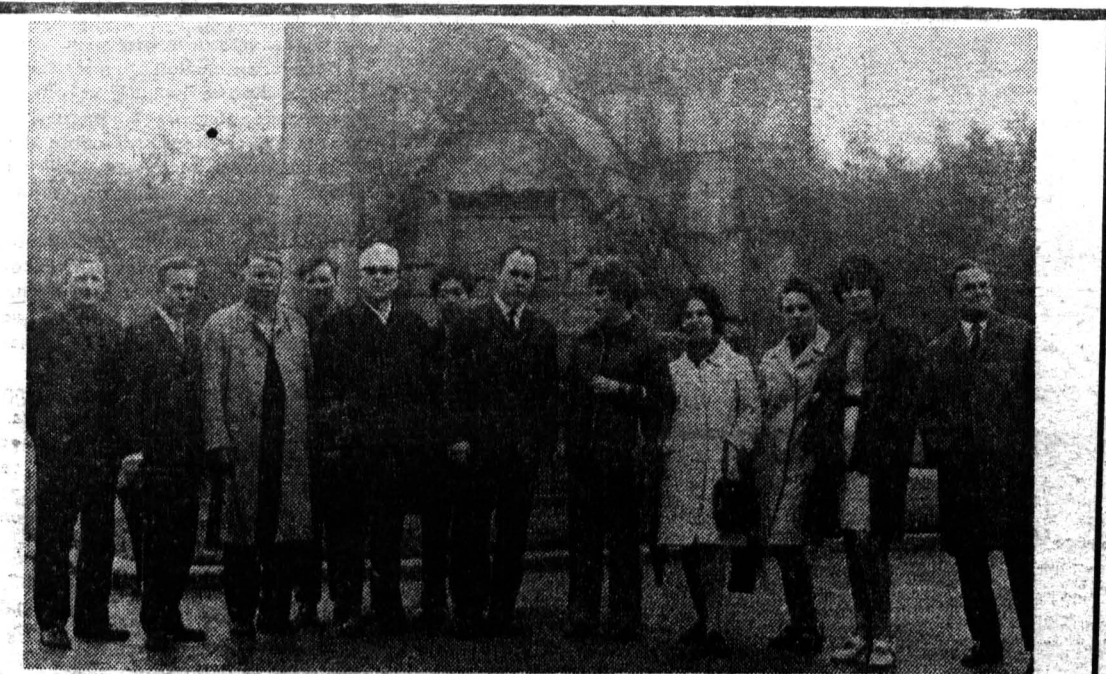
Слушатели ФПКП на экскурсии по местам, связанным с деятельностью В. И. Ленина. В Разливе.

М-14234 Заказ № 2273 Орлена Трудового Красного Знамени типография им. Володарского Лениздата, Ленинград, Фонтанка, 57.