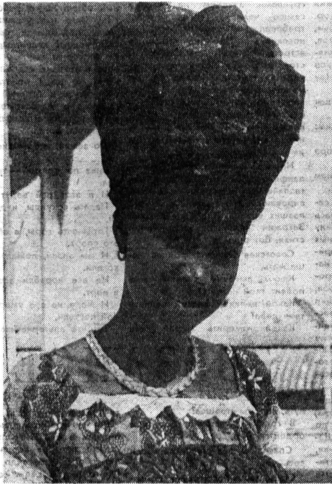
Перед поездкой в Москву, на фестиваль. Гостя из Сенегала.