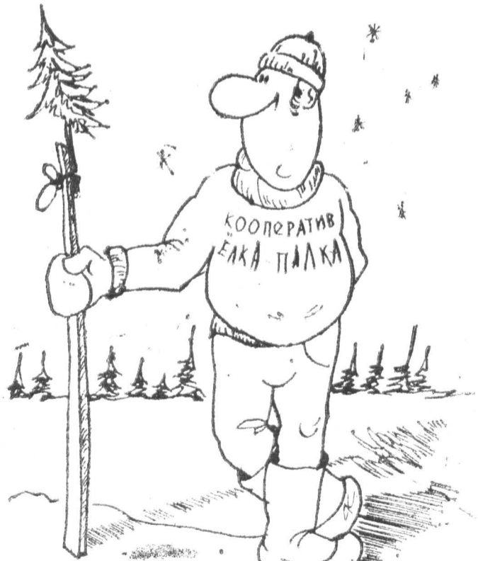
Рис. А. Козержевского