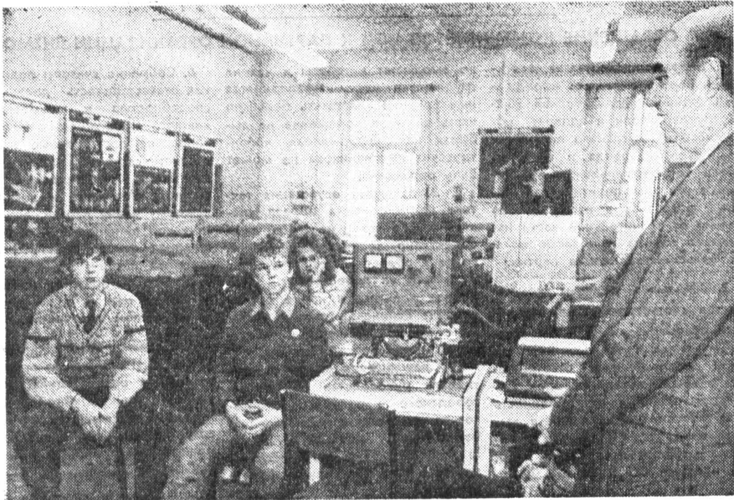
День открытых дверей на кафедре оптических приборов.