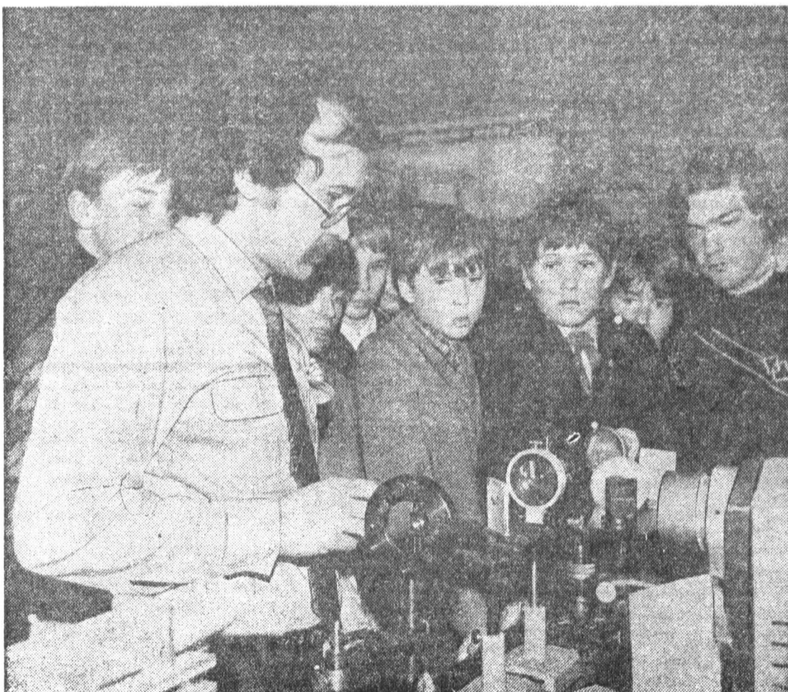
Ученики подшефной школы в лаборатории кафедры СОФП.