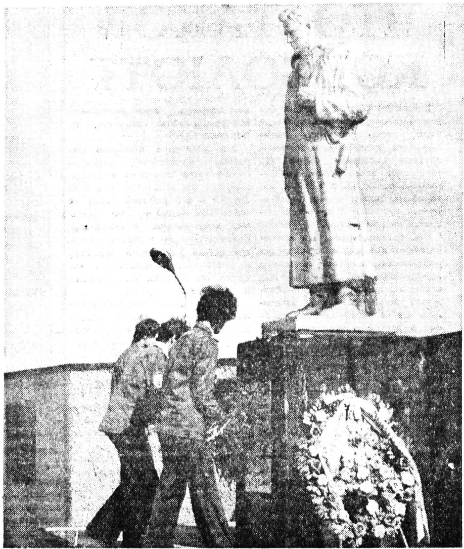
Студенты ЛИТМО, трудившиеся в третьем семестре в составе зонального стройотряда «Гатчинский», свято чтят память героев Великой Отечественной. На снимке: возложение венка к подножию монумента советскому солдату в поселке Войсковицы Гатчинского района.