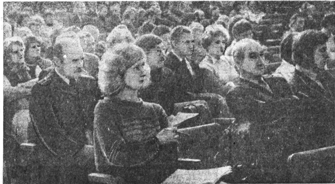
На собрании народных контролеров института.